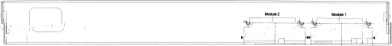
图 2-3 S2126S 后面板说明图

如图 2-3 所示，S2126S 千兆以太网交换机的后面板包括 2 个千兆模块插槽和交流电源开关等。