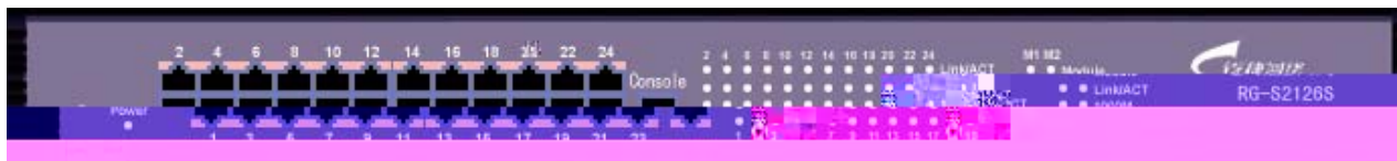
图 2-2 S2126S 前面板图

如图 2-2 所示，S2126S 智能型千兆以太网交换机的前面板包括 Console 端口、24 个 10Base-T/100Base-TX RJ45 端口、LED 指示灯。