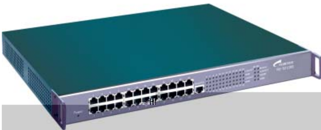
图 2-1 S2126S 产品外观图